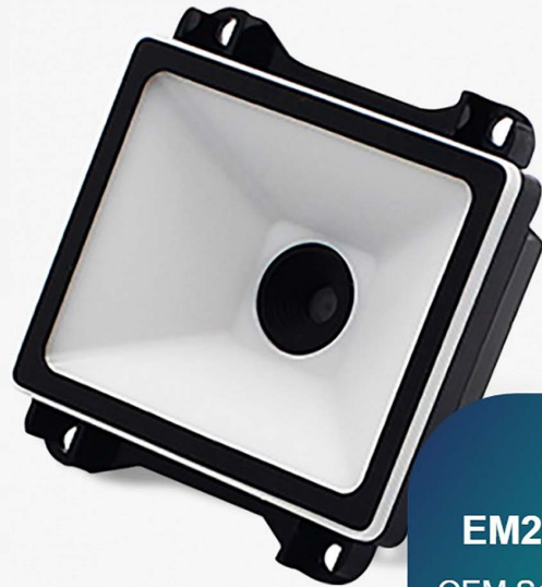
EM20-80 V2 OEM Scan Engines